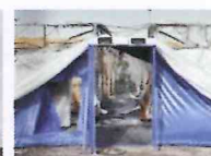
Brand Flüchtlingsheim komplett ausgebrannt