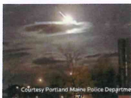
US-Polizei filmt Meteor an nächtlichem Himmel