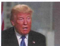
Trump zeigt Reue