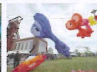
Drachenfest Bunte Punkte am Himmel