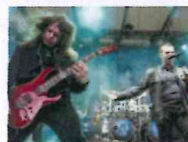
Rock Hard Festival Heimspiel für Sodom