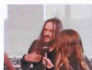
Festival Backstage mit Sodom beim Rock Hard